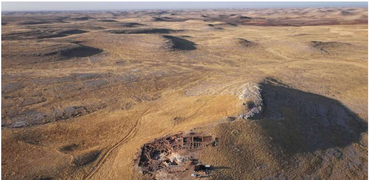
Luftbild von Karahantepe

Mit gewaltigen Statuen, Monumentalgebäuden und massiven figürlich verzierten T-Pfeilern – stilisierte Menschenbilder von bis zu sechs Meter Höhe – ist vor 12.000 Jahren die Welt der Jäger-Sammler am Übergang zur Sesshaftigkeit voller faszinierender Bildwerke und Symbole. Wer hat sie geschaffen und was bedeuten sie? Lange bevor Stonehenge errichtet oder die ersten Pyramiden erbaut wurden, schufen die ersten sesshaften Gemeinschaften in der Provinz Şanlıurfa im Südosten von Türkiye einmalige monumentale Gebäude mit fantastischen überlebensgroßen Bildwerken in Göbeklitepe, seit 2018 UNESCO-Weltkulturerbe, und in weiteren Orten. Die gewaltigen Bauten und der künstlerische Ausdruck sind als Werk von Gemeinschaften zu verstehen, die sich mit Beginn der Sesshaftigkeit bildeten. Der Zusammenhalt war ein wichtiger Faktor für das Leben der Gruppen und ihre Resilienz unter sich wandelnden Bedingungen. Seit 2020 zeichnen spektakuläre Entdeckungen des internationalen Forschungsprojekts Taş Tepeler in Orten wie Karahantepe, Sayburç und Çakmaktepe ein umfassendes Bild dieser revolutionären Epoche.